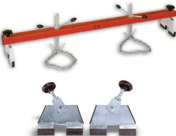
Art. 06031000 | Optional Set di 2 pezzi di supporti orientabili per Art. 111 Set of 2 pieces of adjustable stands for ref. 111

Art. 111 Traversa di sollevamento per motore, dotata di due ancore filettate, di posizione regolabile. Consente di ancorare e sollevare il motore, per eseguire riparazioni meccaniche senza dovere estrarre il motore dalla carrozzeria. È CONFORME AI REQUISITI DIRETTIVA MACCHINE (2006/42/CE).