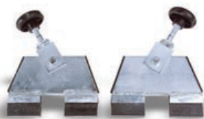
Supporti orientabili compresi in Art. 111S Adjustable stands included in ref. 111S