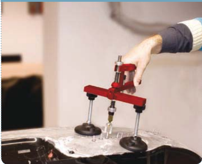
Per riprazioni su lamierati in alluminio / For dent ripare on aluminium panels

FALCON HAND PULLER è una versatile attrezzatura manuale per l'eliminazione delle ammaccature o "bolli" adatto a diverse tecniche di riparazione: