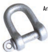
Art. 904 | Grillo Shackle