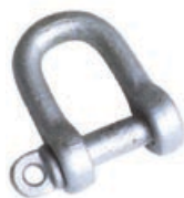
Art. 904 | Grillo Shackle