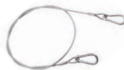
Art. 80 | Cavo di sicurezza Safety cable

Il cavo di sicurezza è fortemente raccomandato unitamente all'utilizzo di ogni tipo di morsetto e gancio di tiro. The use of the safety cable is strongly recommended together with all pull clamps and hooks.