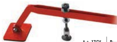
Art. 175V Power Lift, versione per tasselli + colla, version for glue pulling

1 adattatore per ventose 1 adapter for glue pads 1 gancio di tiro per golfari e bits 1 pull hooks for threaded rings and bits