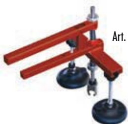
Art. 179V Pistola manuale in alluminio con piedi snodati Hand puller in aluminum with mobile feet

1 adattatore per ventose 1 adapter for glue pads 1 gancio di tiro per golfari e bits 1 pull hooks for threaded rings and bits